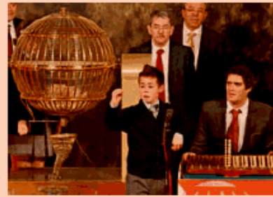
תגלית לטו בספרד. חשדיה נמסר לגייס כ-1 מיליארד דולר

המדינות ישתמשו בכספים כדי לשפר את מצבן הפיננסי • הבורסה בת"א ממשיכה לאבד גובה: ירדה היום בכ-1% ונפלה כ-7% מהשיא / עמ' 1716 ו"שוק ההון"